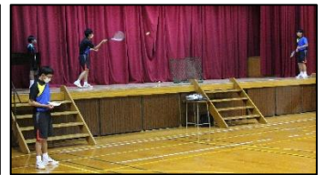
男子ソフトテニス部