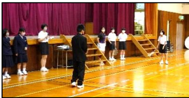
女子ソフトテニス部