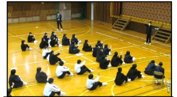
吹奏楽演奏前の即興アドリブ