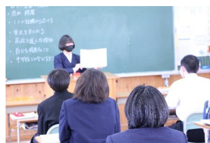
堂々と自信を持って表現