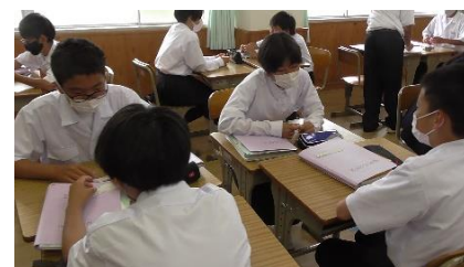
学び合いの活性化