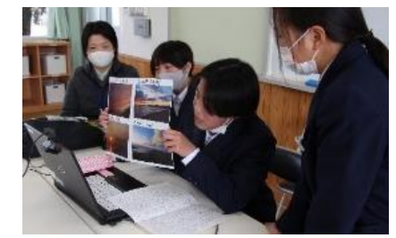
地域PR活動（オンライン）