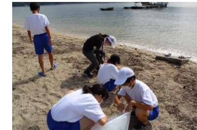
地域ボランティア清掃