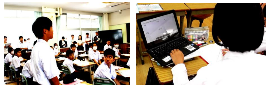
堂々と自信を持って表現