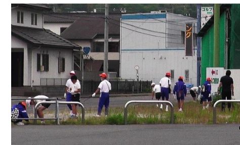
小中高合同ボランティア